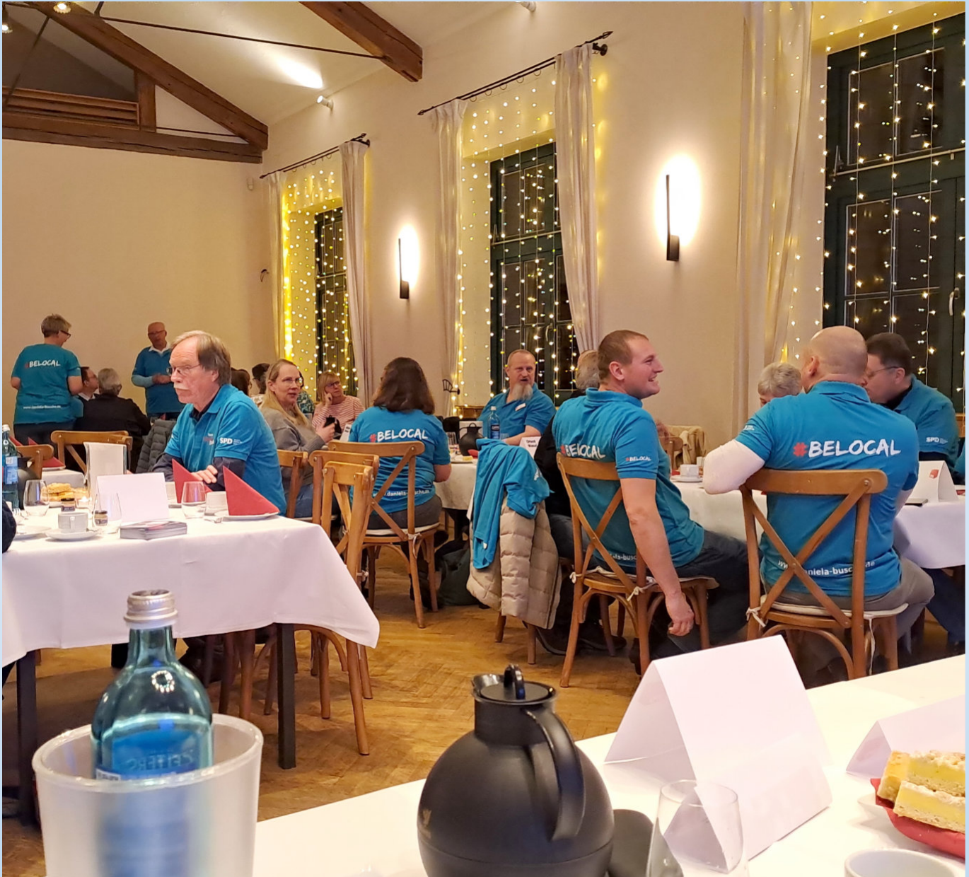
Mitgliederversammlung am 15. Januar 2026 im Gutshof Rethmar.