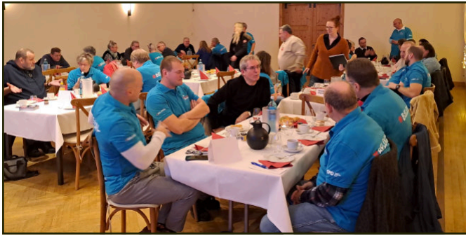
An allen Tischen herrschte ein reger Austausch.