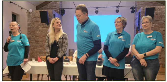
Antworten zur Frage: „Warum engagiere ich mich?“.