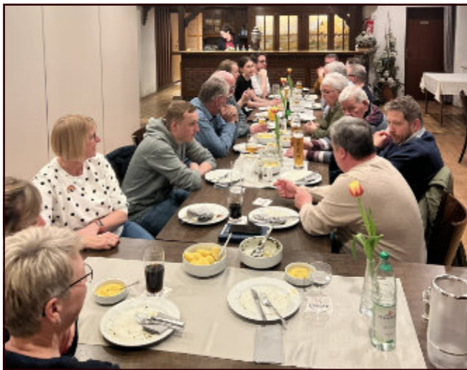
Genossinnen und Genossen, Unterstützer und Interessierte in geselliger Runde beim Grünkohlessen in Müllingen.

Um 21.15 Uhr klang der Abend in gemütlicher Runde aus.